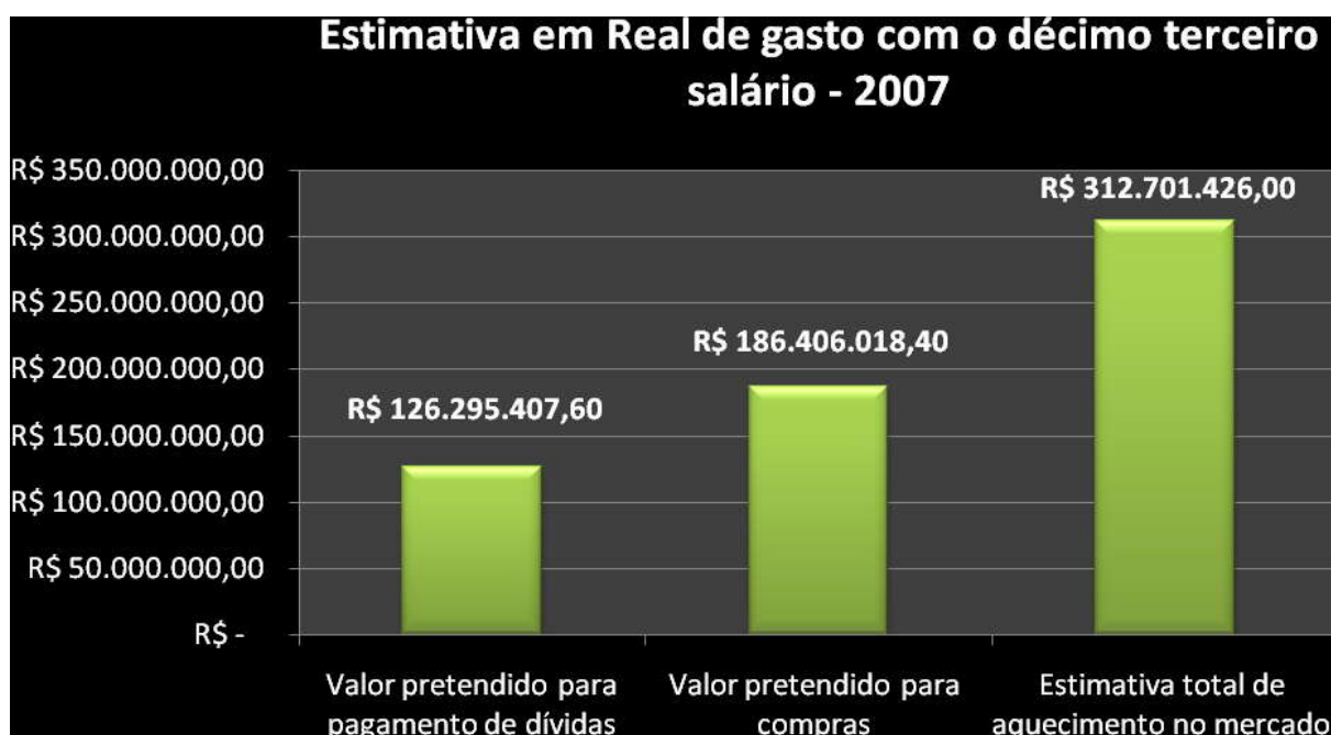
Gráfico1. Estimativa de gasto utilizando o décimo terceiro salário

Entre essas pessoas destacam-se as que demonstraram interesse em pagar as suas dívidas e as que pretendem realizar suas compras utilizando o seu décimo terceiro.